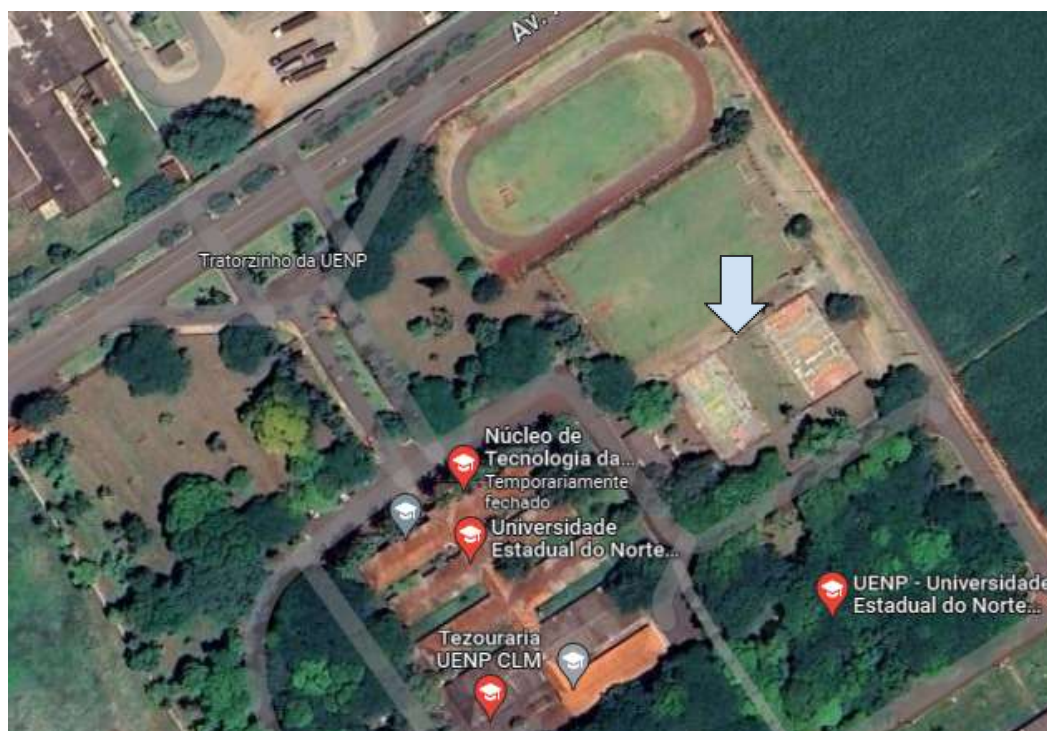
Figura 1: Campus Luiz Meneghel/ Bandeirantes.

Edificação: Quadras poliesportivas descobertas.